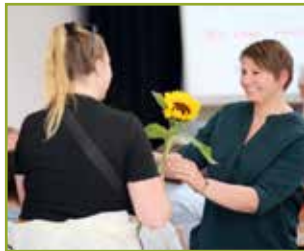
Dankeschön fürs Ehrenamt