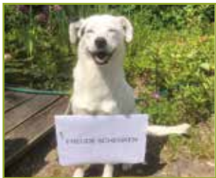
4 Pfoten für Sie